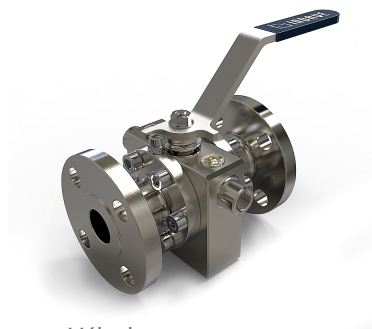
Válvula apta para calefacción.

Compromiso con la Calidad: Nos enorgullece brindar productos de alta calidad que aseguran durabilidad y rendimiento en cualquier aplicación. Cada válvula pasa por rigurosos controles de calidad antes de ser entregada.